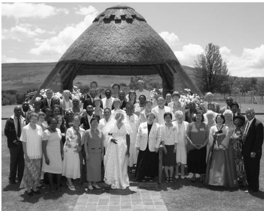
Hela konferensgruppen samlad.

Första dagen ägnades åt ett ämne kallat International Saline. Saline är salt på engelska och Jesus säger ju att vi kristna är jordens salt. Detta