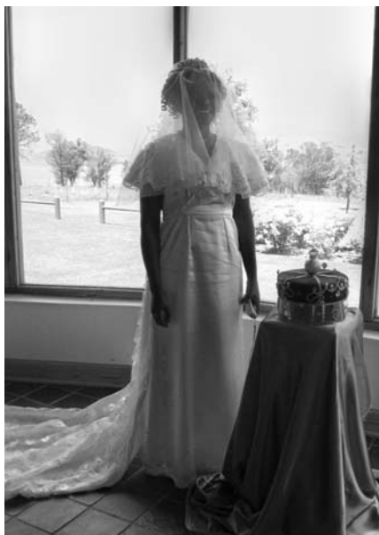
Bruden och livets krona, en symbol för vår eviga gemenskap med vår Frälsare.

Det som är så fantastiskt med dessa konferenser är den goda gemenskap som man upplever med människor från så många olika delar av vår värld. Det är en försmak av vad vi en gång ska få uppleva i himlen. I Uppenbarelseboken 19 står om Lammets bröllop. Jesus är vår himmelske brudgum och Guds församling är bruden och därmed är vi inbjudna till bröllopfesten från alla folk och stammar och länder och språk. Det var också tanken bakom söndagens gudstjänst. Den började med att en ung flicka klädd som brud gick in i kapellet och efter kom representanter från 18 länder bärande sina länders flaggor. Framme i