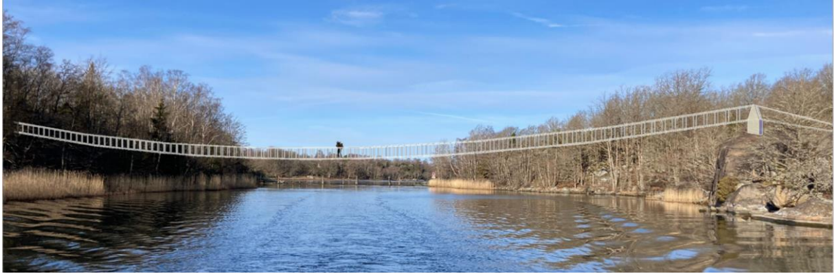
Fotomontage över planerad ca 100 m lång hängbro över Boksundet. Bild/Montage: Magnus Broomé/Thomas Kamrad C & H

men ett avslag för den längre hängbron över Kohagesundet. En ny ansökan om en träbro som ersätter hängbron skickades in. Med klartecken för en sådan bro i början av 2024 kan vi nå målsättningen att länka samman de båda lederna Kohageleden och Allböleleden till en sammanhängande led.