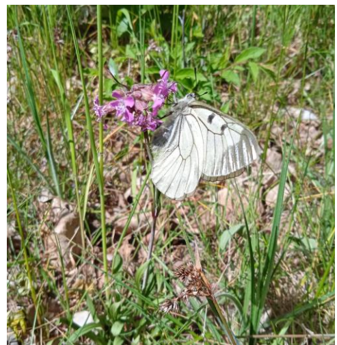
Mnemosynefjärilen – en hotad art som finns i Blekinge.