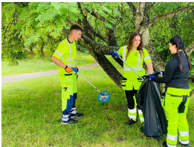
Feriearbetare som städar i strandnära områden.

Under året har även strandstädningar arrangerats i Karlskrona skärgård och Hällaryds skärgård för allmänheten och föreningens biosfärambassadörer. Ett gemensamt strandstädningsevent genomfördes med Sölvesborgs kommun, Sölvesborg Mjällby Sparbank samt Mjällby AIF i maj.