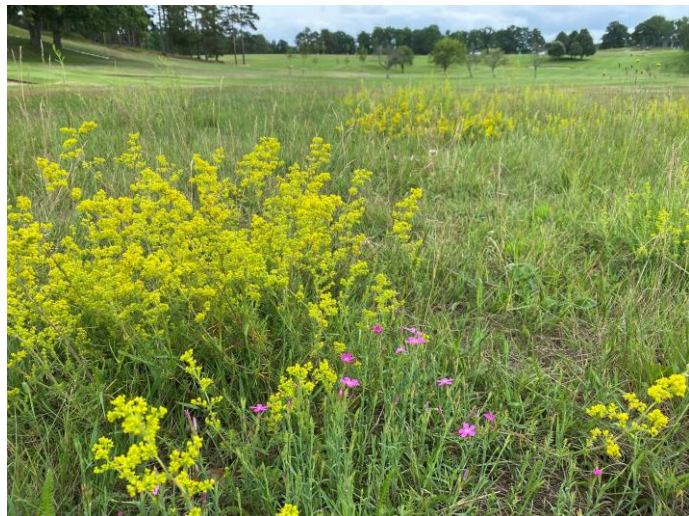
Genom att sköta högruff och sidoytor som ängsytor kan golfklubbar gynna ängsväxter och pollinatörer.

Under sommaren gjordes en inventering av hur golfklubbarna arbetar med hållbarhet idag och vilka åtgärder de är intresserade av att jobba med i projektet. Initialt har mycket fokus legat på att arbeta med åtgärder kopplade till vatten – att säkra tillgången till vatten, hushålla med vatten och samtidigt kunna bidra till vattenrening. Under vintern har fokus gått över mer på biologisk mångfald och studiebesök på klubbar som är goda exempel i våra grannlän.