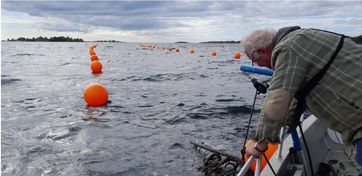
Kontroll av musselpåväxt vid de tre odlingsnät som ligger vid Eriksbergs stränder, Hällaryds skärgård, Karlshamns kommun.