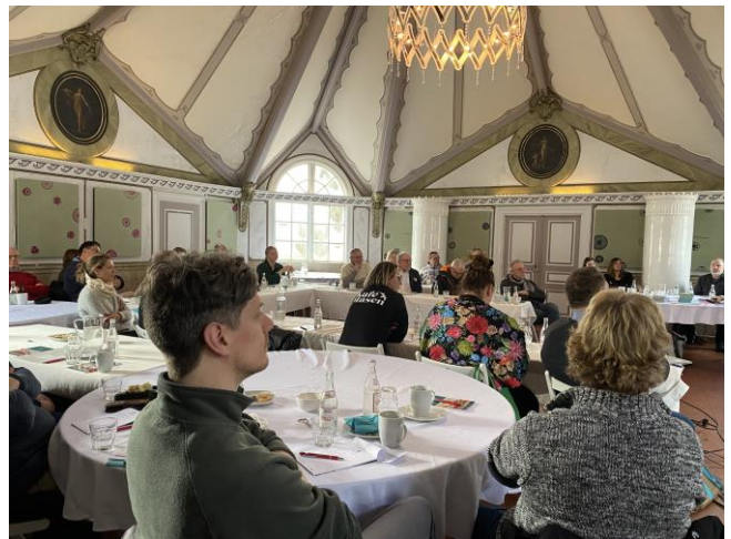
En checklistan som kan underlätta turistföretags hållbarhetsarbete presenterades vid en företagsträff på Skärva Herrgård

Tio tjänstemän har genomgått en utbildning i hållbar destinationsutveckling. Vi har blivit medlemmar i Global Sustainable Tourism Council (GSTC) – ett nätverk med koppling till FN.