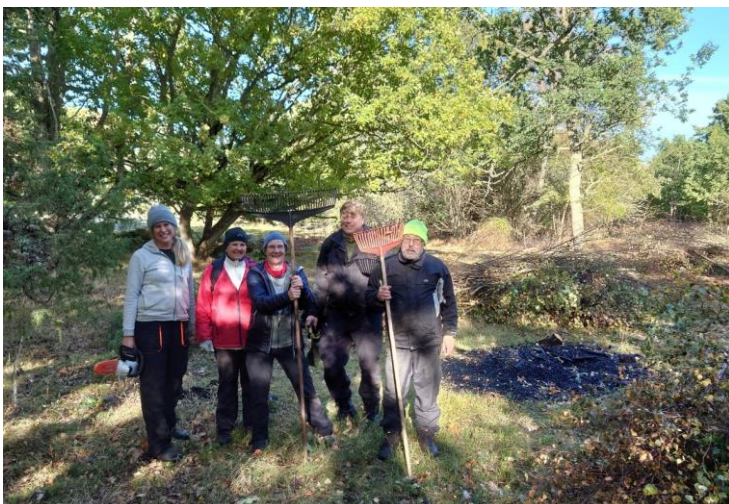
Några av våra nya biosfärambassadörer hjälpte till att dra ris för att återställa naturbetesmark på Tärnö.