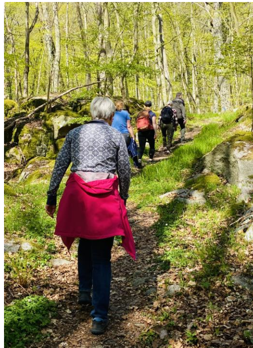
Blivande biosfärambassadörer på vandring på Listerlandet samt tur runt Hanö.

Under året har våra ambassadörer varit representanter för föreningen vid Naturens dag i Ire, vid Sillarodden i Ronneby hamn, på Äventyret Halen, på strandstädning i Hällaryds skärgård under Håll Sverige Rent dagen samt varit behjälpliga vid röjning och borttagning av ris i samband med återskapande av betesmarker på Tärnö. Tack till alla fantastiska ambassadörer som ställer upp och gör vår medverkan möjlig där kontoret och styrelsen inte räcker till!