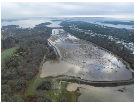
Dalamadens våtmark vid Skillingenäs har en vattenyta på ca 14 hektar. Under året har lekande gädda från den intilliggande Skillingebäcken lyft in i våtmarken.

Dalamadens våtmark vid Skillingenäs i Karlskrona kommun färdigställdes i sin första version under 2021. Under 2022 fick den förbättrade vallar, en ny pump och stängsling för att betesdjur ska kunna bidra till skötseln av våtmarksområdet som spänner över ca 20 hektar. Sportfiskarna i Blekinge har under våren 2023 följt upp antalet stigande fiskar i diket och lyft gäddor in i våtmarken. Ett förslag till att förbättra fiskvägen (inloppet till våtmarken) har tagits fram. Åtgärder för att förbättra fiskvägen genomförs under 2024.