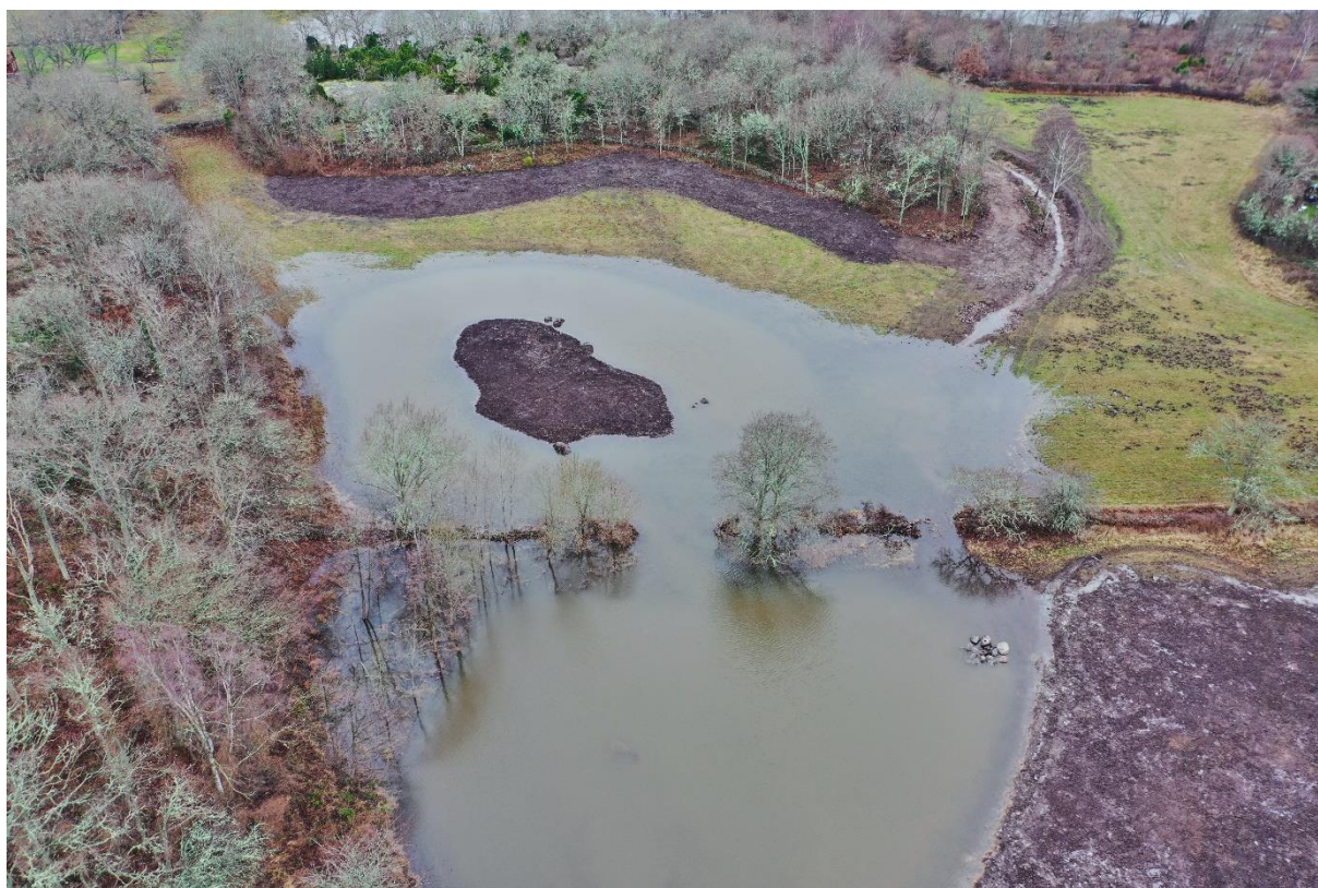
Den nya våtmarken på Brunnsvik som den ser ut när den fyllts upp till utloppets nivå.

Mycket av arbetet i våtmarksprogrammet består förberedelser för att identifiera nya våtmarkslägen, knyta kontakter med markägare, konsulter och reservatsförvaltare. När vi är överens med markägare skrivs kontrakt om utredning respektive anläggning av våtmark. Mycket av arbetet handlar därför om rådgivning.