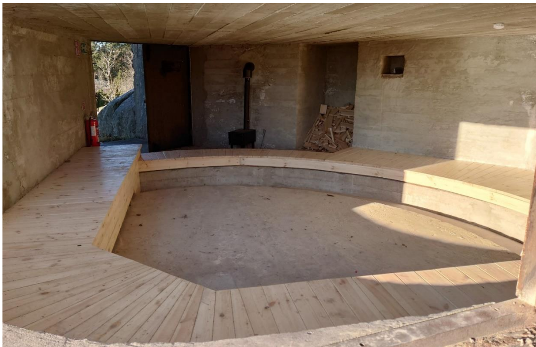
Två pjäsvärn längs med Allböleleden har gjorts iordning och kommer kunna användas för övernattnig under 2024.

Broarna kommer att möjliggöra en kustnära vandringsled mellan Karlshamn och Ronneby, vilket Karlshamns kommun fortsatt arbetar aktivt med att förverkliga. Med detta skulle ett stort steg tas närmare en kustled genom hela Blekinge och möjligheten att bli en av STF:s så kallade signaturleder. Det skulle vara ett bra sätt att skapa ökat intresse för biosfärområdet och ge både det rörliga friluftslivet och naturturismen inom ARK56 ett betydande uppsving.