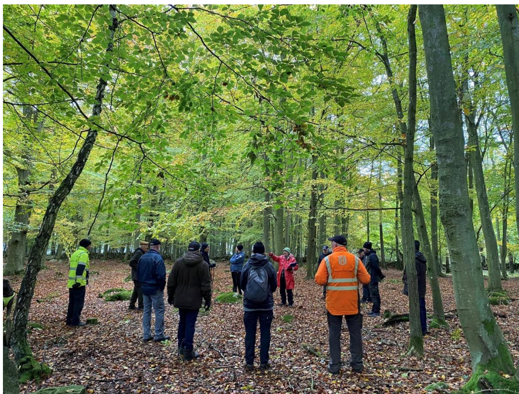
Nätverksträff i Lörby skog, hösten 2023.