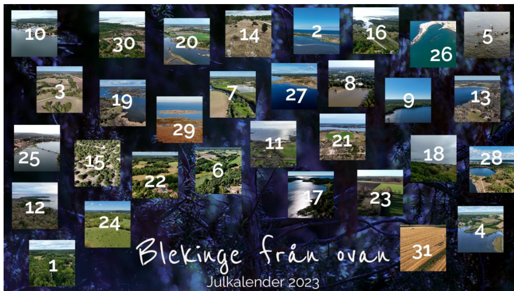
Filmerna släpptes i december som en julkalender.

En av årets höjdpunkter var den digitala julkalendern med 31 drönarfilmer som gav en upplevelse av Blekinges kust, såsom en havsörn kanske skulle se den. Urban Emanuelson tog fram själva filmserien med syftet att bidra till ökad kunskap om natur- och kulturmiljöernas samband i vårt biosfärområde.