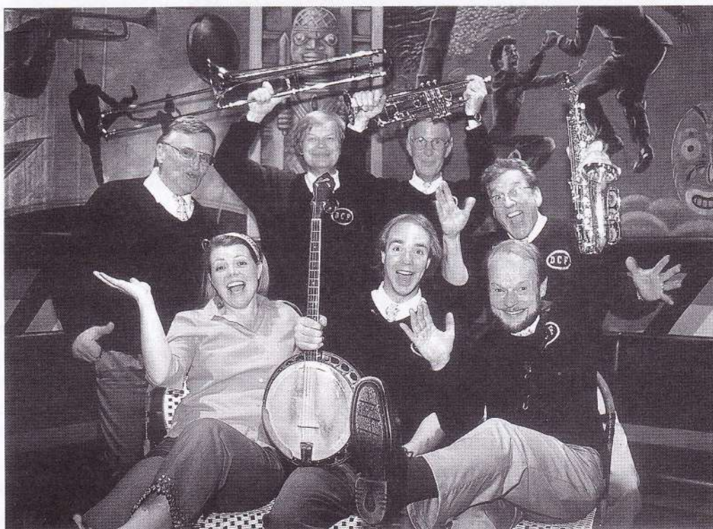
Dixie Con Fusion