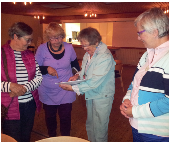
Några av mötesdeltagarna, bl.a. långväga gäster från Danmark och Norge.