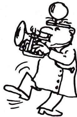
DOCTOR JAZZ STOMP

7/12 No Generation Jazz Soloist Ensemble (NOGENJA)