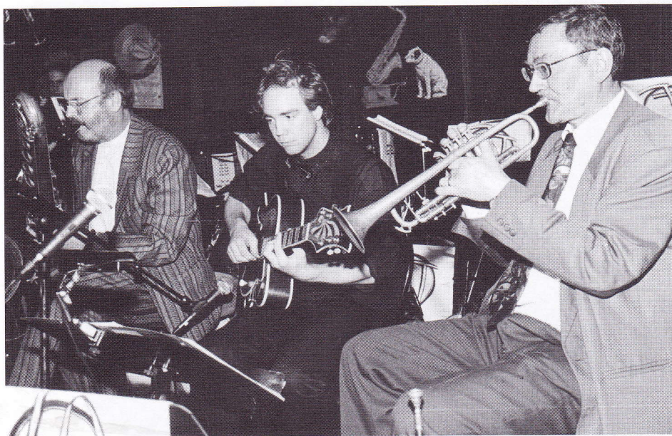
Hot Jazz Trio