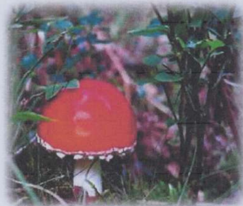
Hasselfors byalag, Torpgruppen

2017-09-16/sammanställt av Cristina Söderberg