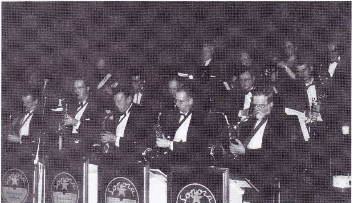
Sonora - Täby Storband

Som framgår av ovanstående innehåller bandet 15 manliga och två kvinnliga med-