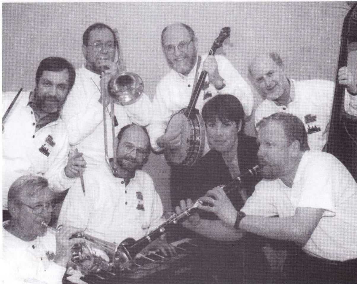
New Orleans Express