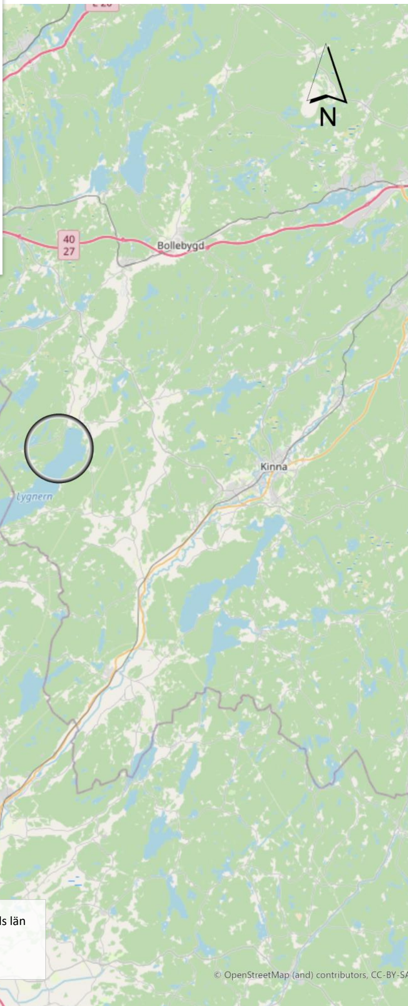
Figur 1. Översiktskartor över Västra Götalands län med platsen för undersökningen markerad. ESRI baskartor.