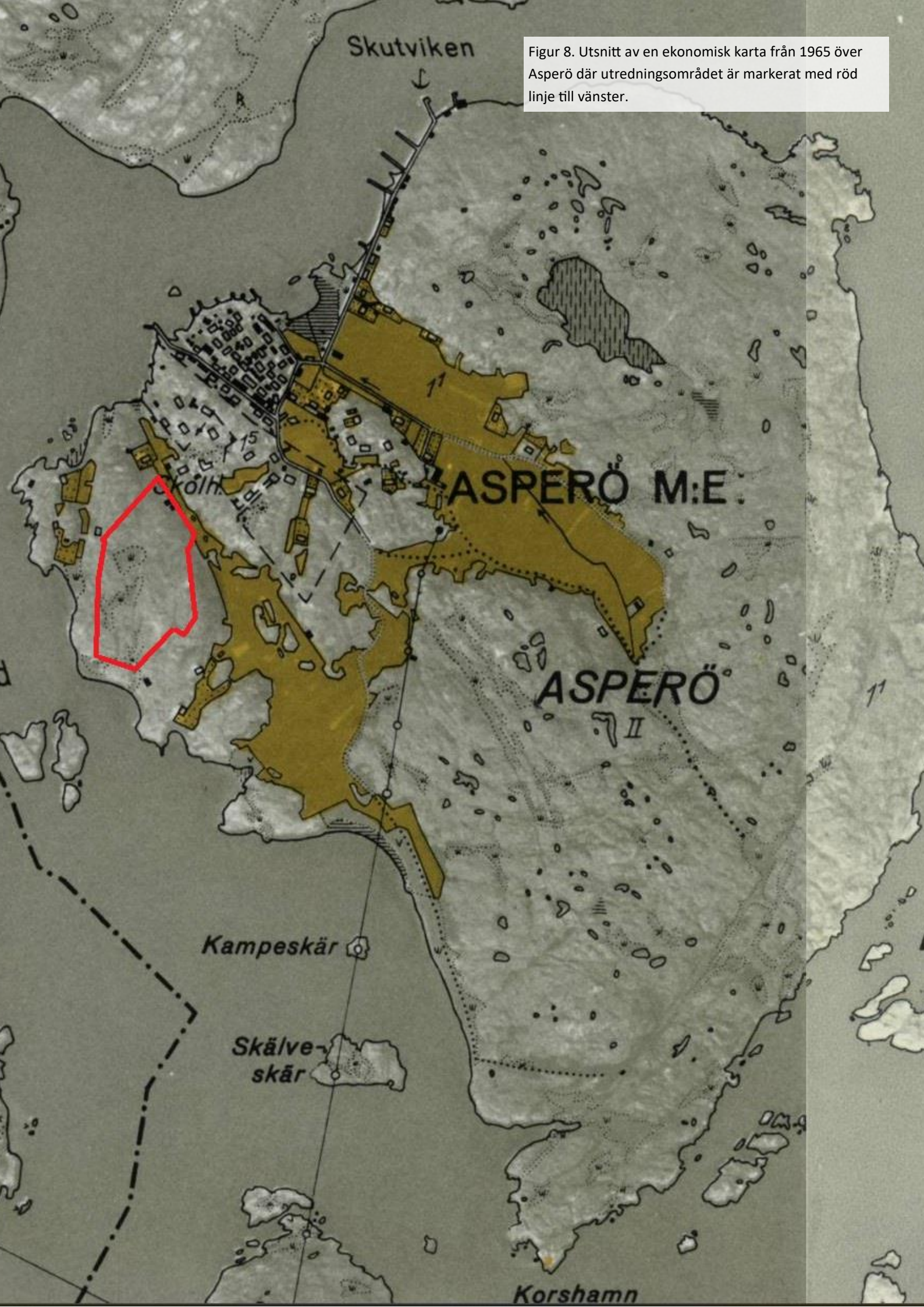
Figur 8. Utsnitt av en ekonomisk karta från 1965 över Asperö där utredningsområdet är markerat med röd linje till vänster.