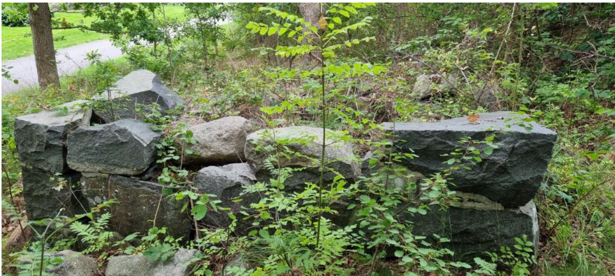
Figur 5. Foto från norr som visar delar av den ovannämnda källargrunden L2023:4097.

Längst i norr registrerades en sentida källargrund som enligt uppgift skall ha anlagts i slutet av 1800-talet och som övergavs på 1960-talet. Lämningen registrerades som en övrig kulturhistorisk lämning och erhöll beteckningen L2023:4097 i kulturmiljöregistret.