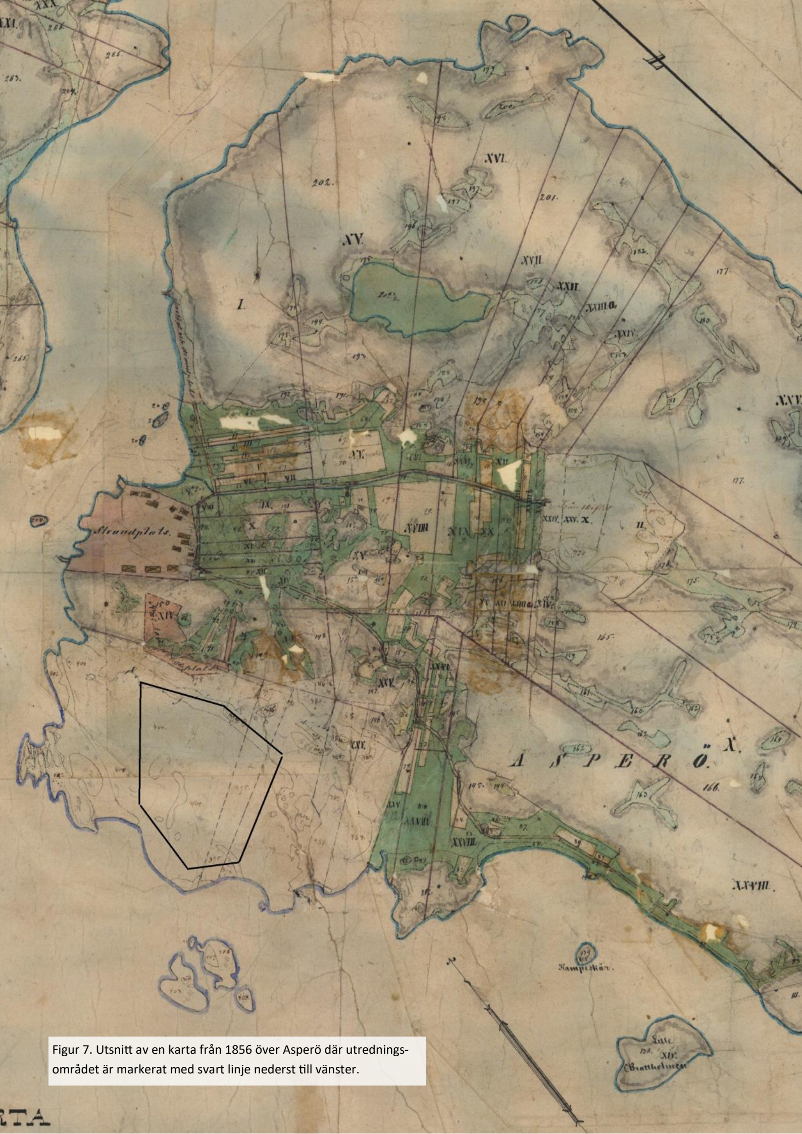
Figur 7. Utsnitt av en karta från 1856 över Asperö där utredningsområdet är markerat med svart linje nederst till vänster.