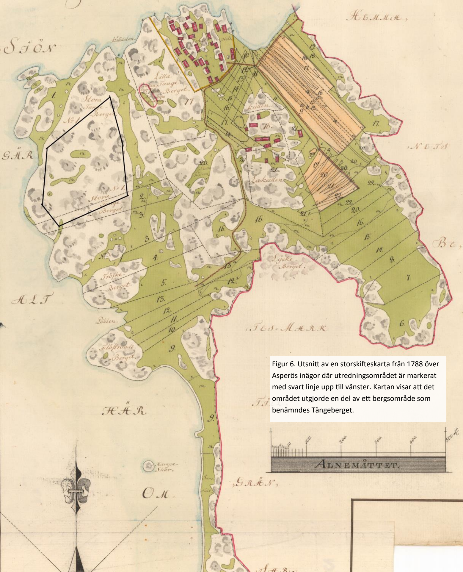
Figur 6. Utsnitt av en storskifteskarta från 1788 över Asperös inägor där utredningsområdet är markerat med svart linje upp till vänster. Kartan visar att det området utgjorde en del av ett bergsområde som benämndes Tångeberget.