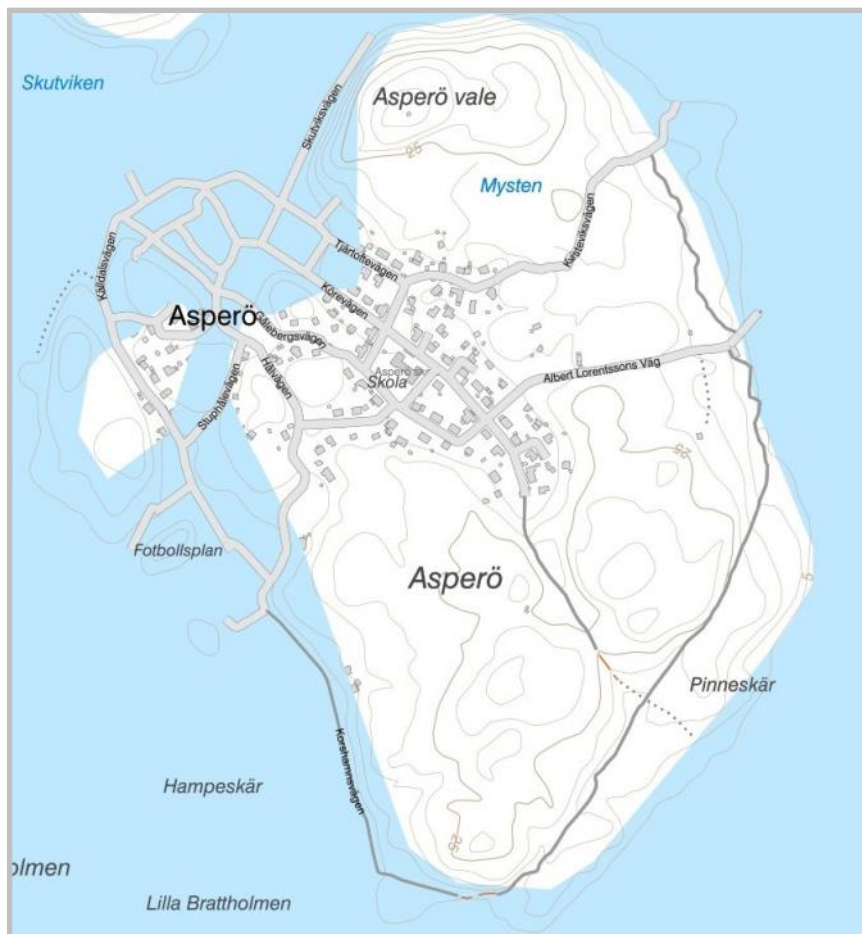
Figur 3. Kartor som visar Asperö 9100 f. Kr. (överst) och 2500 f. Kr (nederst) enligt SGU:s strandförskjutningskurvor.