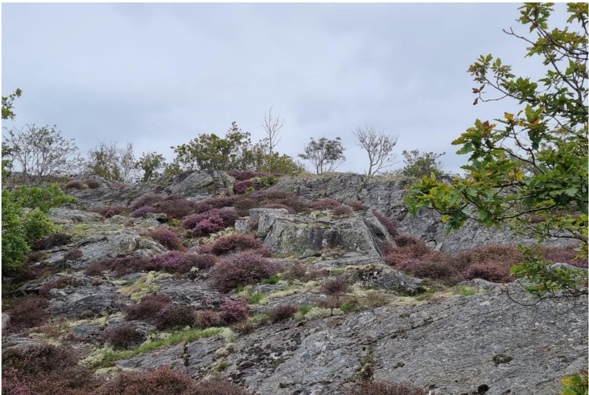
Figur 2. Foto som visar delar av undersökningsområdet.

Det finns inga kända fornlämningar inom utredningsområdet. På Asperö finns endast nio lämningar registrerade i Kulturmiljöregistret i form av två boplatser (L1968:9183, L1968:9801), en rest sten (L1959:4720) en tomtning (L1959:4721) en bytomt/gårdstomt (L2023:3750) och fyra fyndplatser (L1968:9820, L1968:9822, L1968:9821, L19687:342) (se figur 4).