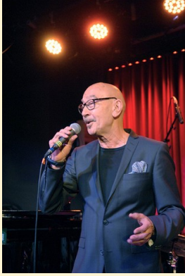
Hayati - hittar artisterna och lyckas boka dem, vad vi än hittar på