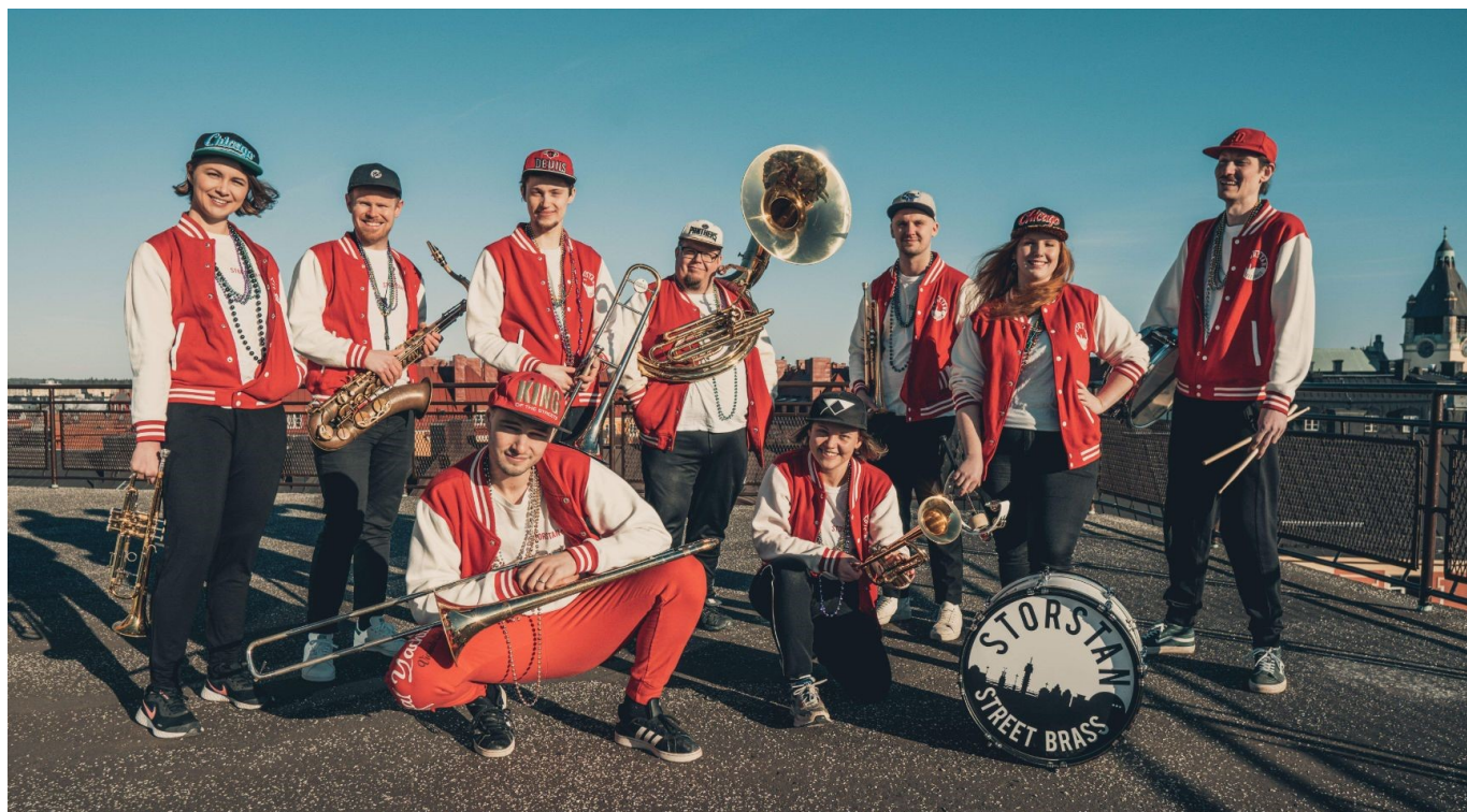
Storstan Street Brass Band