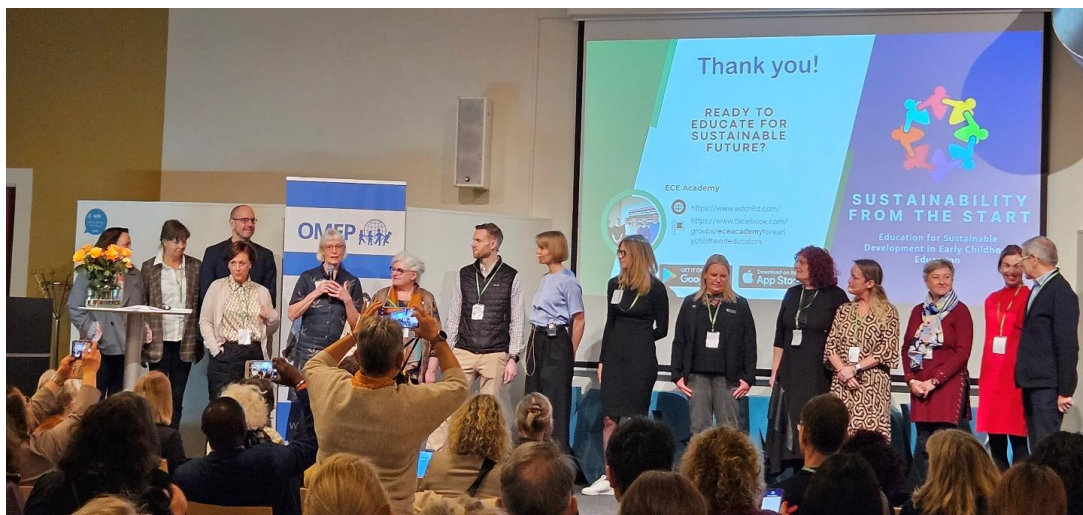
Ledningsgruppen från fem länder som tagit fram kursen Sustainability from the Start.