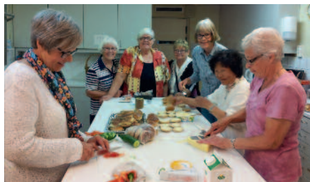
Trogna kämpar i köket ordnar serveringen.