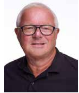
Av Bo Hultén