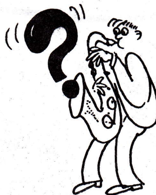
WHAT IS THIS THING CALLED LOVE?

fortsätter sin märkliga resa framåt mot stenåldern. Till deras arbetsmetod hör att överraska, så ofta som möjligt. När de i dagarna dyker upp i Stockholm överraskar de med att framträda på Mosebacke, av alla platser. Den 8/10 inträffar det. Sätt kors i almanackan och i taket!