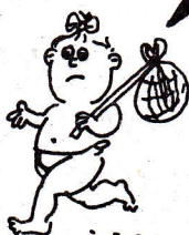
BABY, WON'T YOU PLEASE COME HOME

Annars riskerar Du att bli utan Pi-Jano, nästa nummer skickas bara till våra medlemmar.