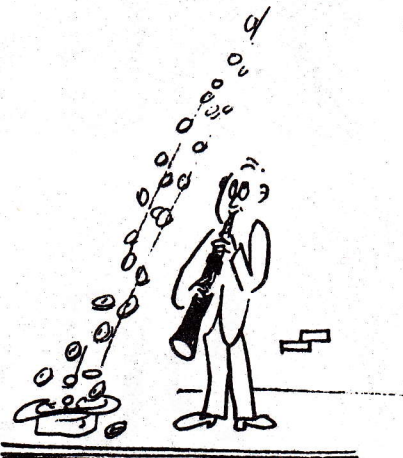
PENNIES FROM HEAVEN