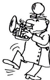
DOCTOR JAZZ STOMP