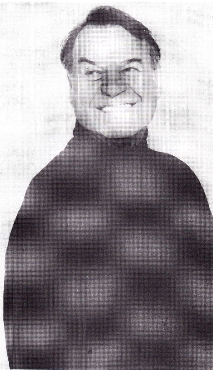
PUTTE WICKMAN

stort antal skivor, radio- och TV-framträdanden, konsertturnéer över stora delar av världen, festivaler, kyrkokonserter. I likhet med t ex Benny Goodman har Putte Wickman också tillägnat sig den klassiska repertoaren. Han har bl a spelat in Mozarts klarinettkvintett på skiva.