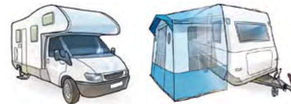
Exempel på campingenheter.

Anslutningsledningar mellan elstolpe och husvagn bör inte vara längre än 25 meter. Undvik sladdvindor, och om sådana används: rulla ut hela sladden. I en upprullad sladd kan värmen stiga så att isoleringen smälter, i värsta fall med strömförande bil och husvagn som följd.