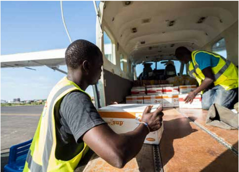
Flygplansstolarna ut och nödhjälp in. Baslivsmedel först innan kylboxarna lastas in i MAF:s Cessna Caravan.