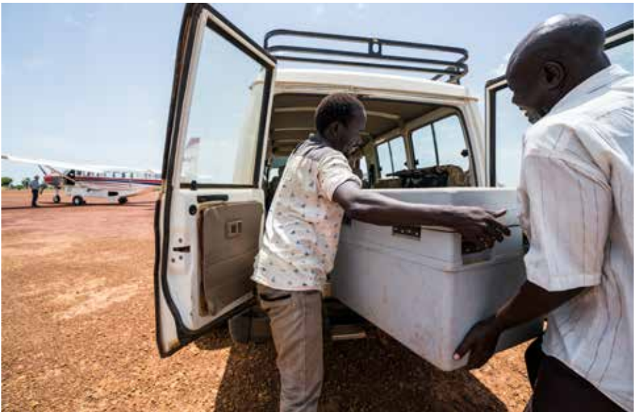
De stora kylboxarna som innehåller mässlingvaccin lastas om från MAF-planet för vidare transport med bil ut till närliggande byar.

Eftersom alla barn mellan sex månader och fem år behöver vaccineras får teamen arbeta snabbt. De behandlar barnen där det är möjligt, t.ex. i skuggan under ett träd. En del barn gråter högt efter sprutsticket. Andra tar smärtan med jämnmod. Vid varje vaccinationsstation köar hundratals trötta mammor med sina små för att få det livräd-