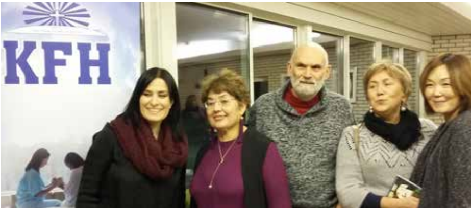
Vänner från Island, Ryssland och Frankrike