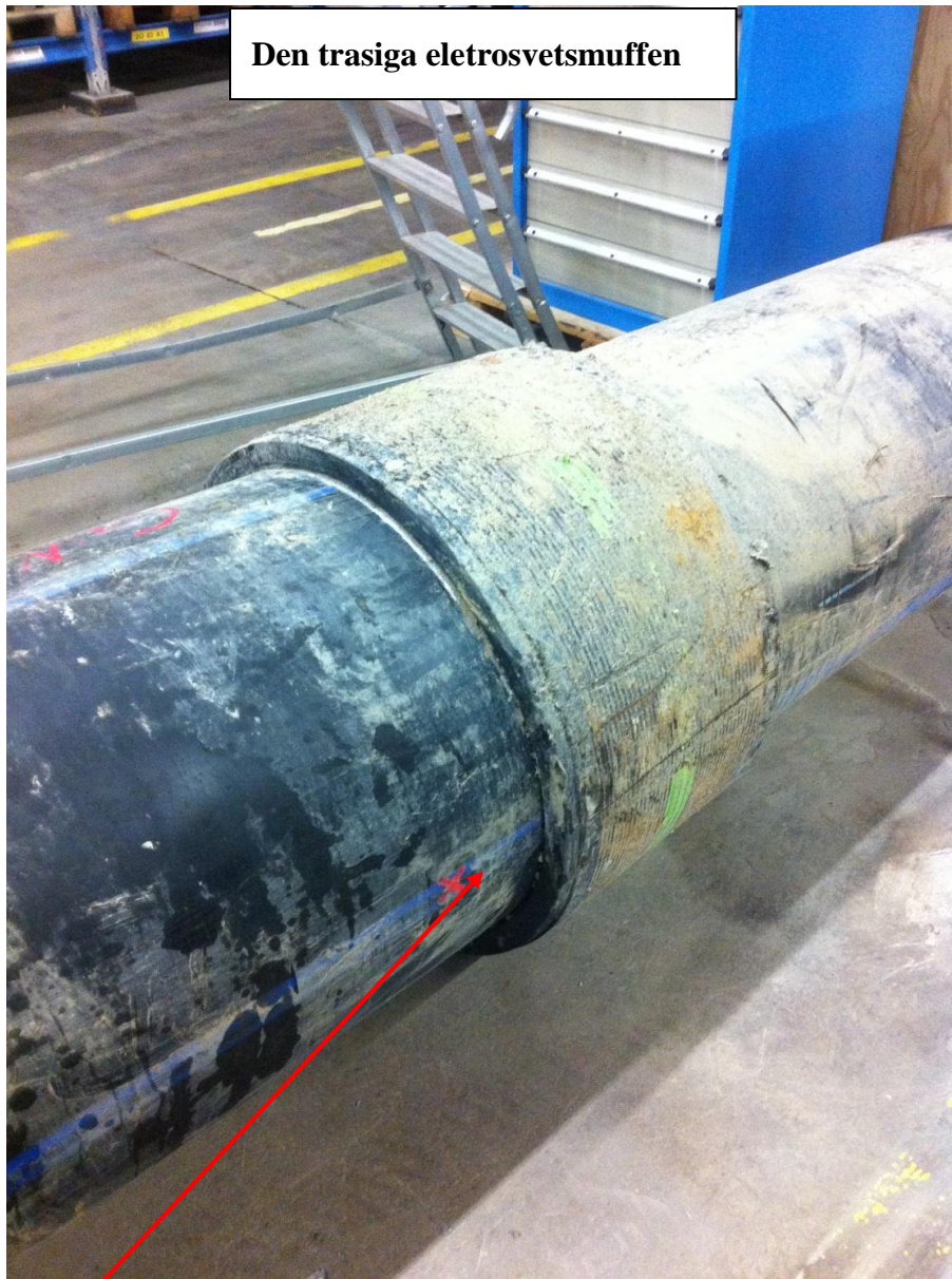
Den trasiga eletrosvetsmuffen

Läckpunkt på elsvetsmuffen, den har skickats iväg för undersökning.