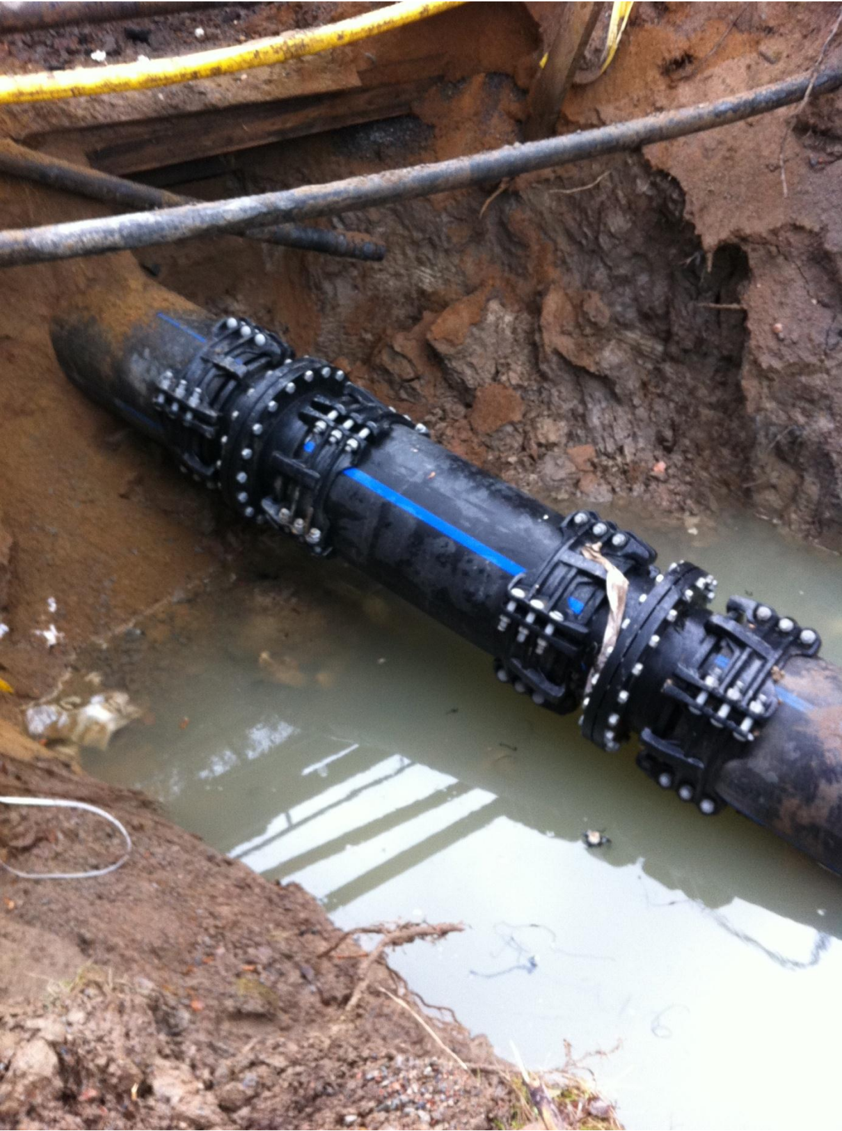
Färdiga reparationen av ledningen.