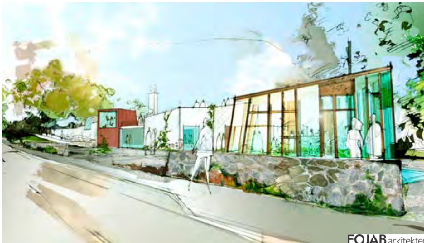
Vy från nordväst