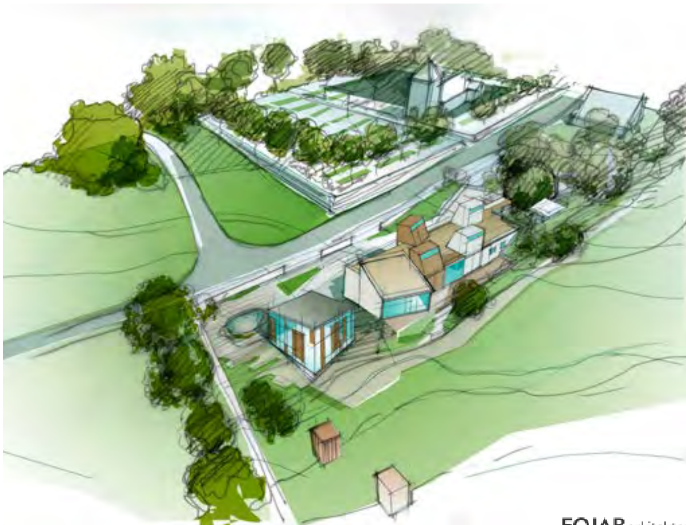
Fågelvy från söder

Materialvalen i byggnaderna speglar idén om rörelse i tid och rum och rörelse i upplevelser och verksamheter. Från det tunga, historiska och permanenta i gråsten/tegel/puts till det lätta, nutida och föränderliga i glas och trä.