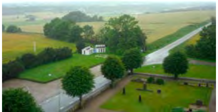
Tomten för inspirationsskisserna intill Harlösa kyrka