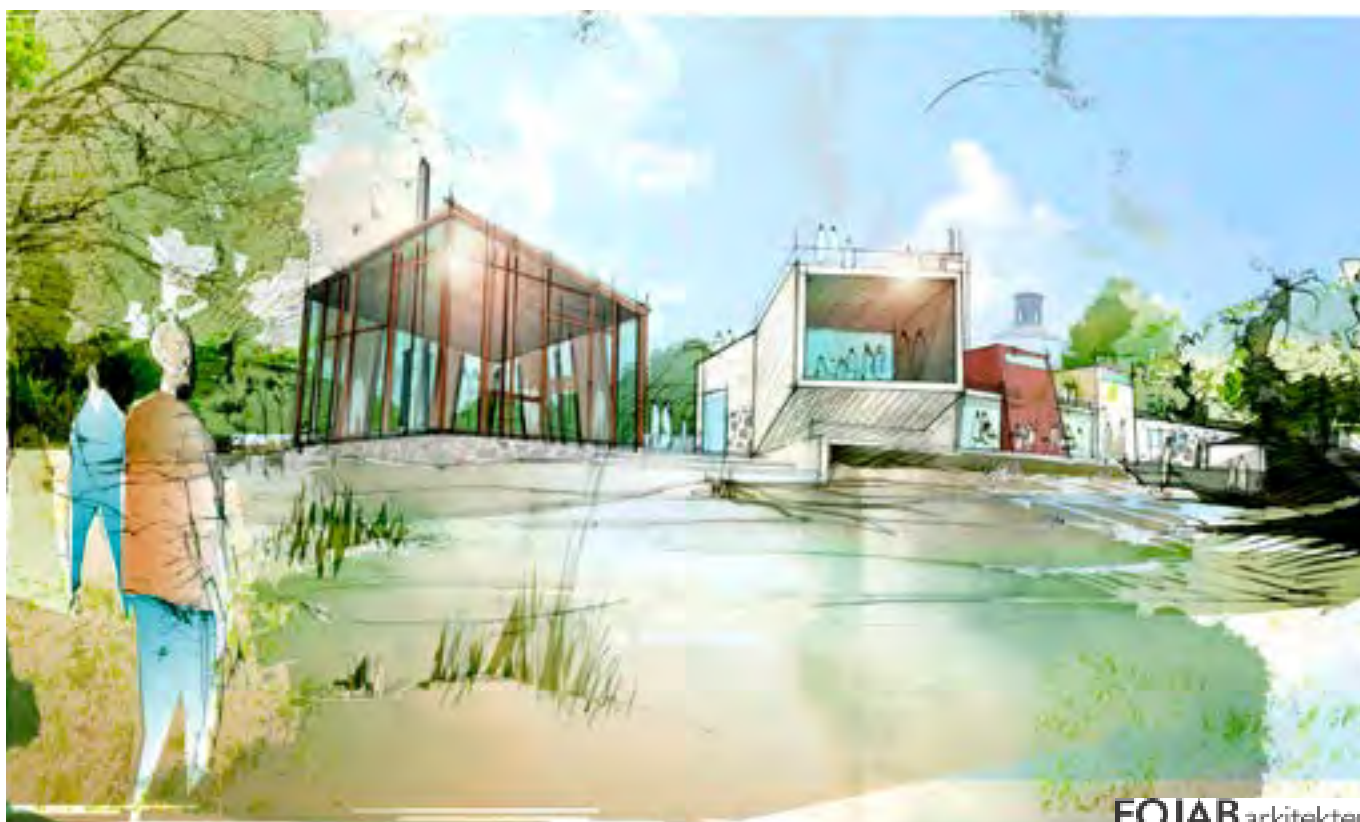
Vy från sydväst