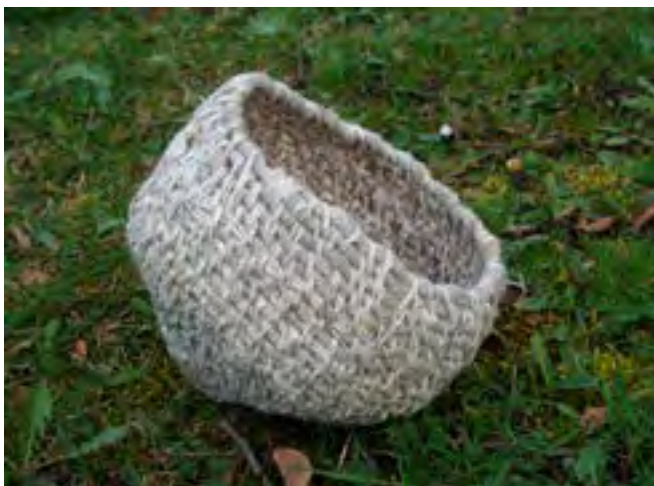
Konstverk Stefanie Robinson

Föreningens vision är att Fågelriket blir ett område som förknippas med kreativ nyfikenhet och som får människor att se och uppleva naturen omkring dem med nya ögon. Här arbetar kulturarbetare från jordens alla hörn och här forskas det på människors förhållande till naturen. För ett besökscentrum med publik verksamhet behövs det möteslokaler, café eller restaurang och utställningsverksamhet. För en sådan verksamhet, som förrenar naturvetenskapens nyfikenhet med idéutveckling och skapande verkstad, blir barn och ungdomar en viktig målgrupp. Av den anledningen har det i projektet ingått att praktiskt pröva hur artist-in-residencet ARNA kan användas för att skapa möten mellan barn, natur och kultur med Fågelriket som bas.