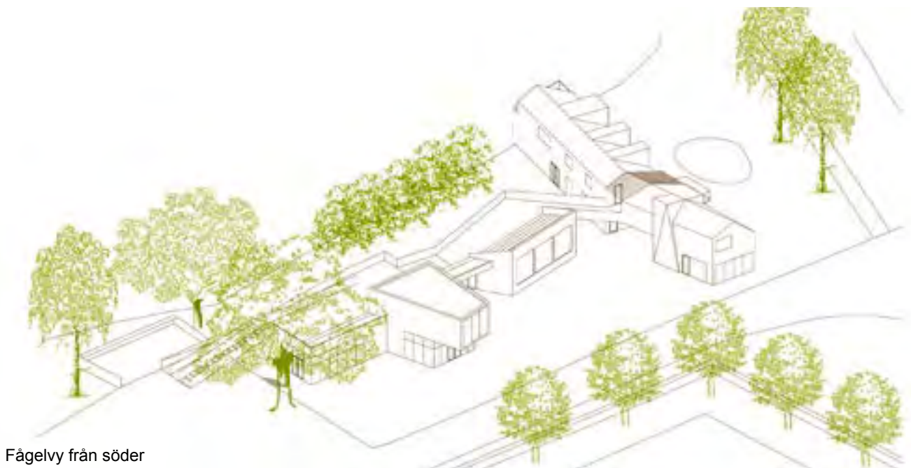
Fågelyv från söder