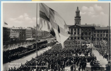
Gustav Adolfs torg vid Jubileumsfesten 1923

Anledningen till att den svenska flaggan på fotografier från 1800-talet och början 1900-talet ser ut att vara vit med ett mörkt kors är att den fotografiska filmen och glasplåtarna hade en ortokromatisk emulsion som var okänslig för rött (rött blev svart), och mycket känslig för blått. Orange och gult blev därför mörkare än normalt medan blått blev mycket ljust.