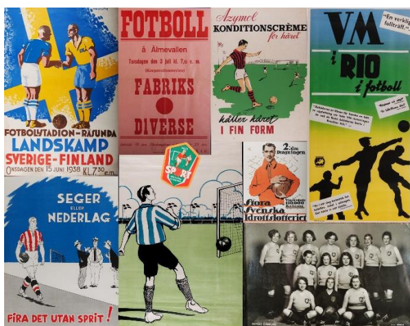
”Kul med fotboll” 2023

Solna Folkets Hus har genom sin föredömliga satsning visat att konst och utställningar med fördel kan lyftas fram och bli en viktig del av den fysiska miljön och verksamheten. Inte minst får barn, unga och vuxna i Solna nu möjlighet att möta och uppleva konst och utställningar i sin närmiljö.