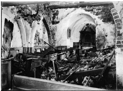
Ignaberga gamla kyrka lämnad i förfall.

Under 1800-talet beslöt Ignaberga sockenmän att skaffa en modernare och rymligare kyrka. Den nya kyrkan i rött tegel invigdes år 1887. Församlingen vägrade bidra till underhåll av den gamla och begärde tillstånd att riva den. Begäran avslogs av Kunglig Majestät. Endast klockstapeln fick rivas sedan kyrkklockorna flyttades över i den nya kyrkan. Vad nära sjuhundra år av krig, inre oroligheter och andra påfrestningar inte orsakat kyrkan, skedde genom vanvård under fyrtio år.