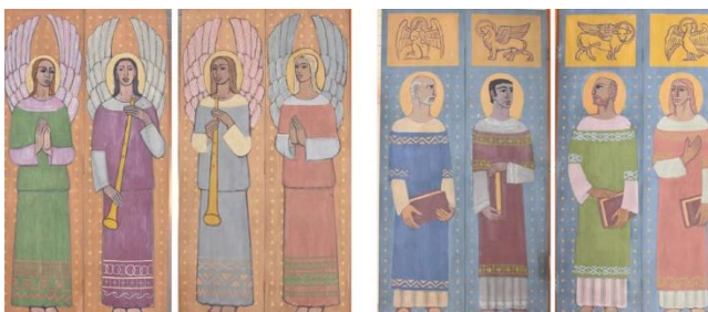
Målningar av Per Siegård

Läktarorgeln är tillverkad på 1970-talet av Anders Persson, Nyhamnsläge. Orgelfasaden är ritad av Torsten Leon-Nilsson. På