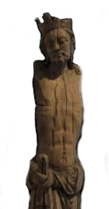
Triumfkrucifixet, Historiska muséet i Lund.