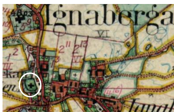
Cirkeln markerar gamla kyrkan mitt i Ignaberga by.

En triumfbåge skilde koret från absiden. Högt sittande smala fönster gjorde kyrkan mörk. Byggnadstypen anses ha utvecklats under inflytande av de stenmästare som arbetade vid Lunds domkyrka på 1100-talet. Vapenhuset byggdes till på medeltiden. Sägner säger att sockenborna tänkte bygga vid en björkbacke ovanför Tykarps by men de fick inte ha bygget ifred. Varje natt förde trollen bort byggmaterialet som tagits dit.