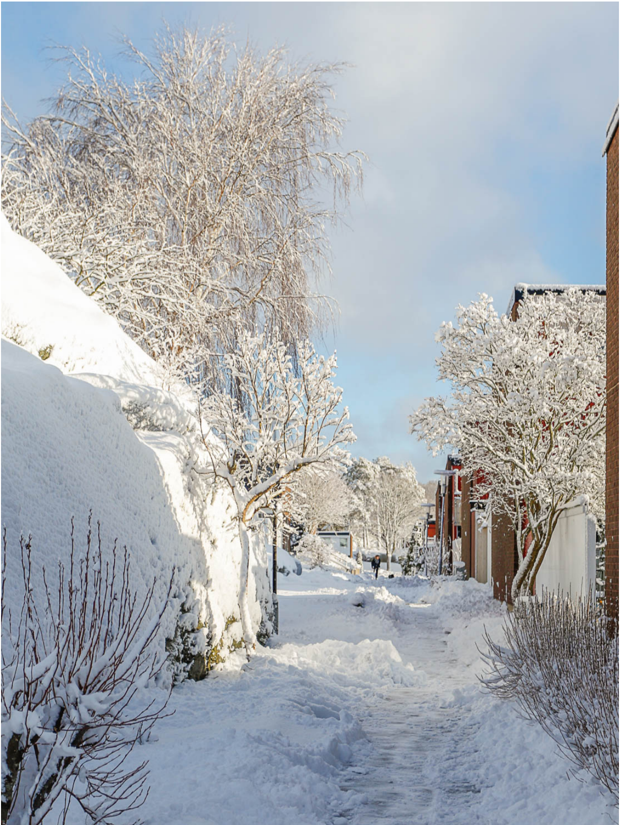
Kan vi hoppas på en vit vinter? Så här såg det ut 19 januari i år