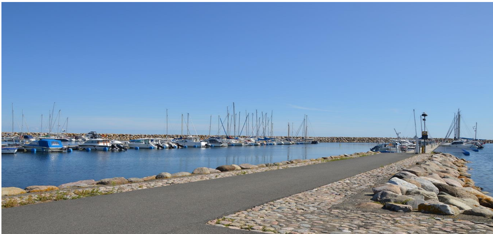
Simrishamn 3 - 4 juni 2021