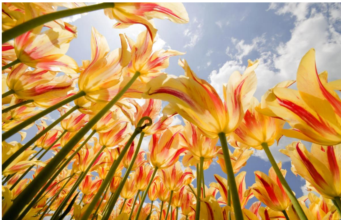
Arkivbild. Tulipaner skymtas mot en blå himmel.