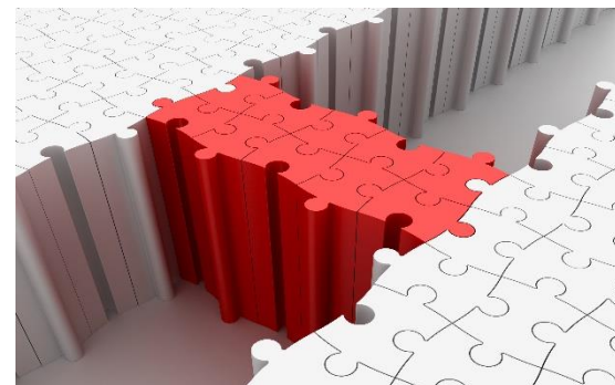
Arkivbild. En röd pusselbrygga som förbinder två öar av pussel.