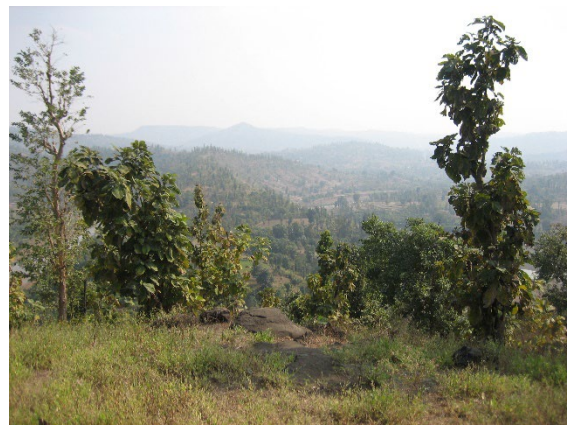
Vy över bergen i Dharampur, Indien.