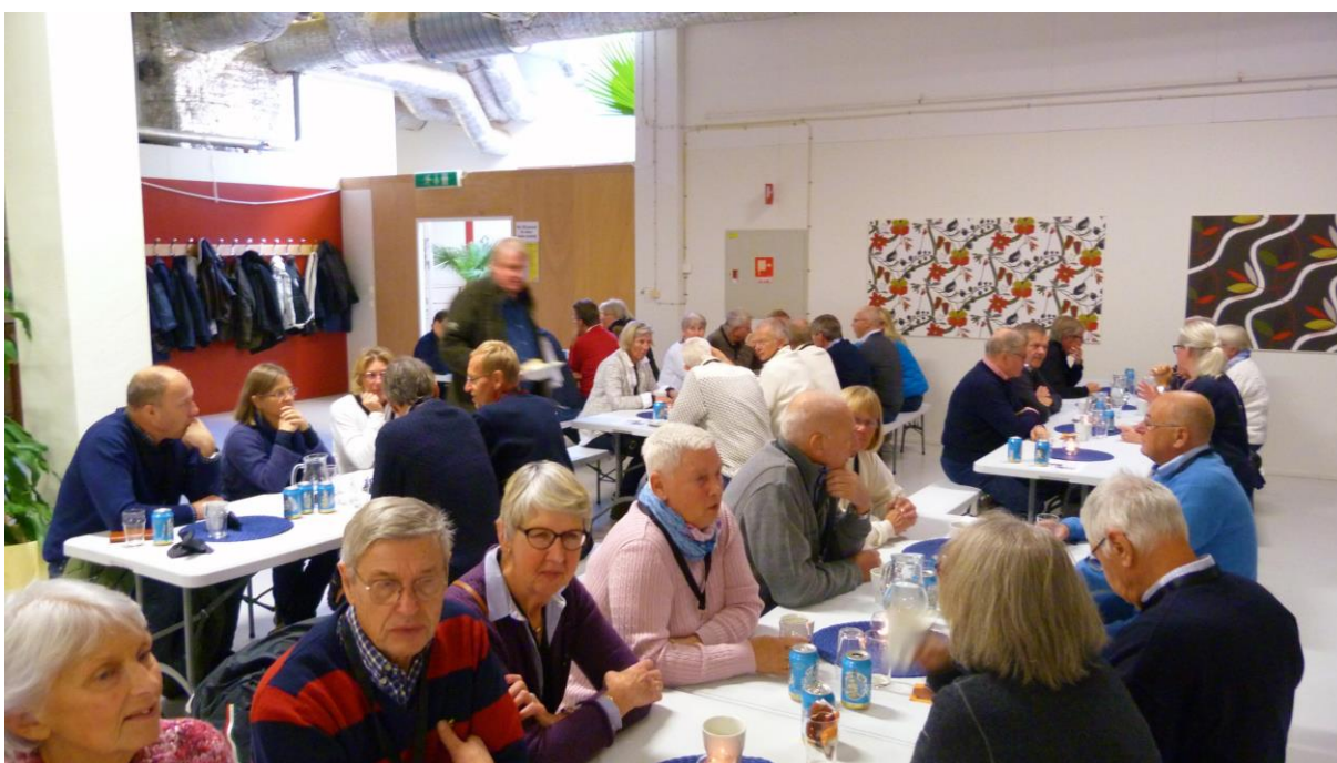
Gemensam lunch för alla klubbmedlemmar