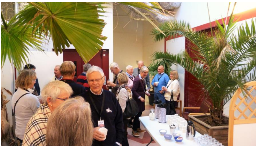
Samling vid fikabordet innan rundvandringen på varvet