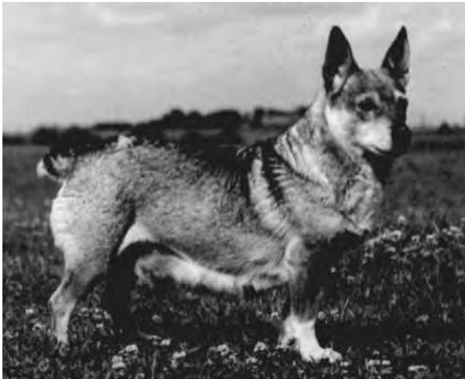
Kantaemo Topsy.

Alkuperäinen tavoiteohjelma on vuodelta 2007.