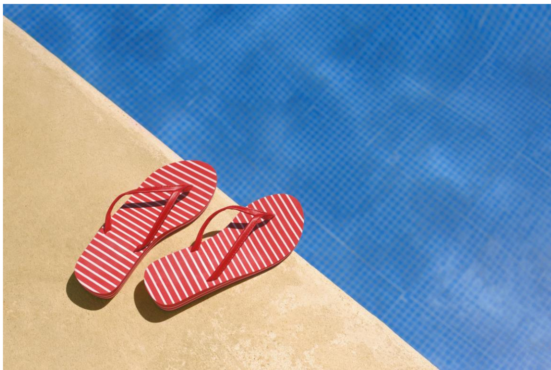
Arkivbild på strandtofflor vid en pool

24 september kl. 08.15 - 10.00 29 oktober kl. 08.15 - 10.00 26 november kl. 08.15 - 10.00