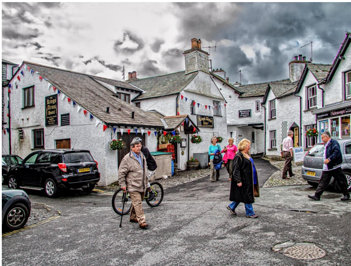
Bild från Lake district i England med titeln trafikultur// Arne Hansson