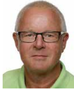
Av Paul Alfons