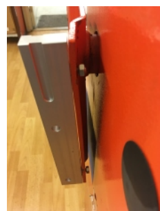
Skruva dit låsmuttrarna för hand