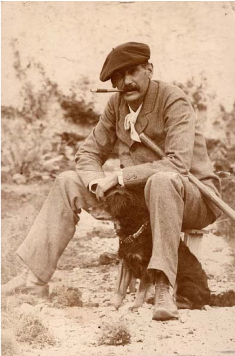
Bild 4 Galdós på familjens ägor i Monte Lentiscal vid ett av de få tillfällen som författaren kom på besök på G.C.