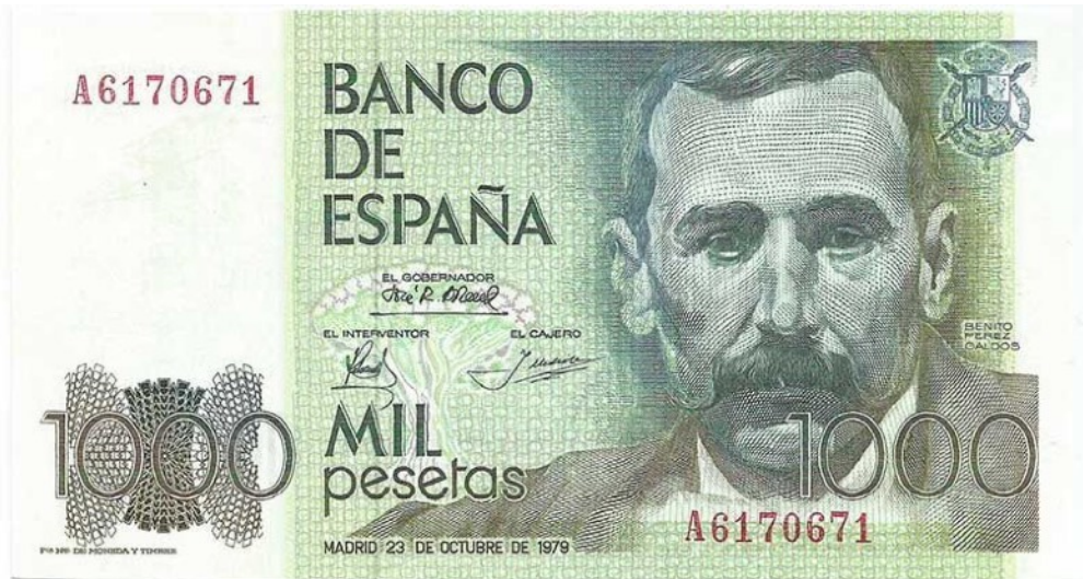
Bild 1 Benito Pérez Galdós på 1000 pesetasedlarna.