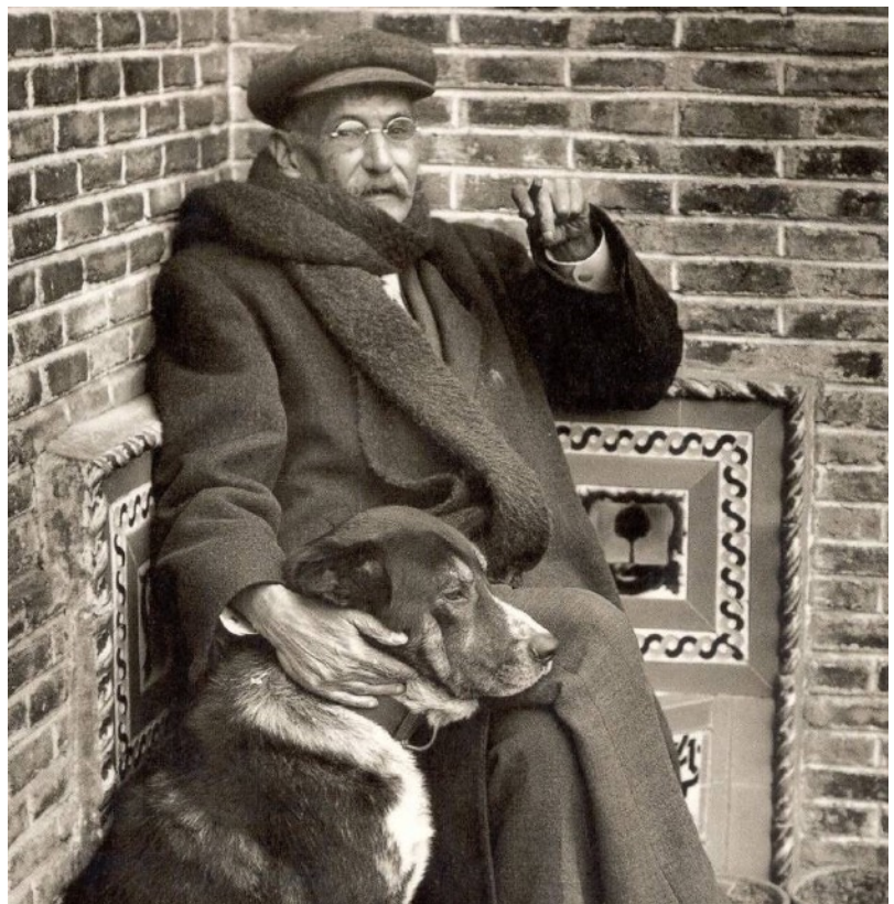
Bild 5 Galdós på ålderns höst.