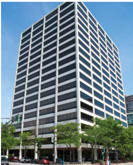
One Rotary Center i Evanston, Illinois, USA

Rotary International styrs av sekretariatet, som består av generalsekreteraren och nästan 800 anställda som arbetar för att ge stöd till klubbar och distrikt i hela världen. Rotarys huvudkontor ligger i Evanston, Illinois, USA, i en byggnad som heter One Rotary Center. I den här byggnaden finns ett auditorium med 190 sittplatser, Rotarys arkiv och en svit med konferensrum för RI-styrelsen och Rotary Foundation-styrelsen samt kontor för RI-presidenten och andra högt uppsatta funktionärer. Här finns även en exakt kopia av rum 711, där