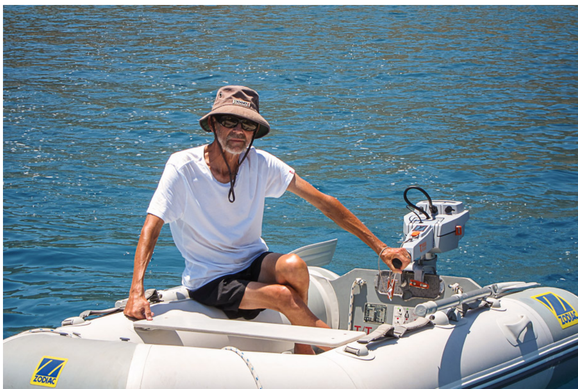
Pserimos, provkör vår nya utombordare, en elmotor. Fungerar superbra