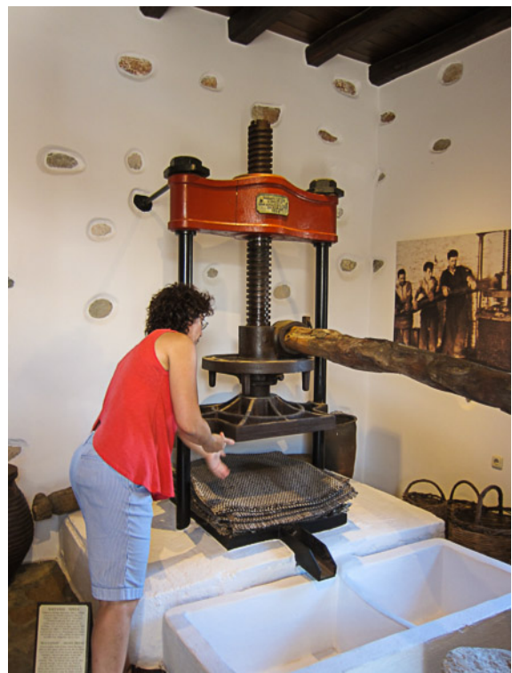
Lunch i lilla staden Apollonas. Besök på ett olivoljemuseum i Eggares