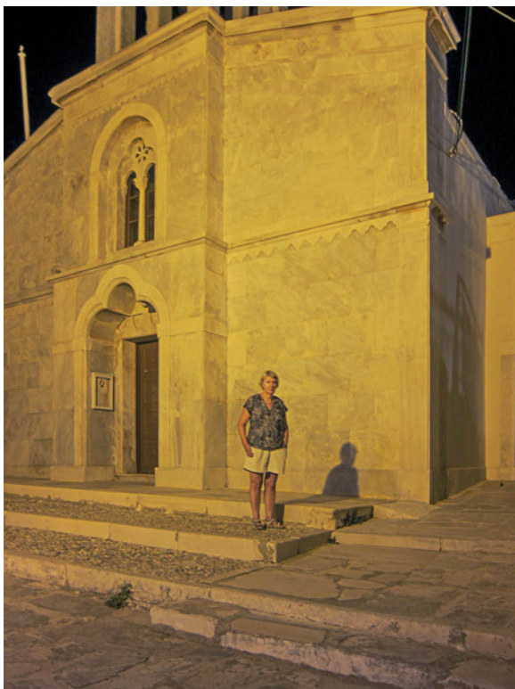
Kvällspromenad upp till den Venetianska borgen med utsikt över Naxos stad