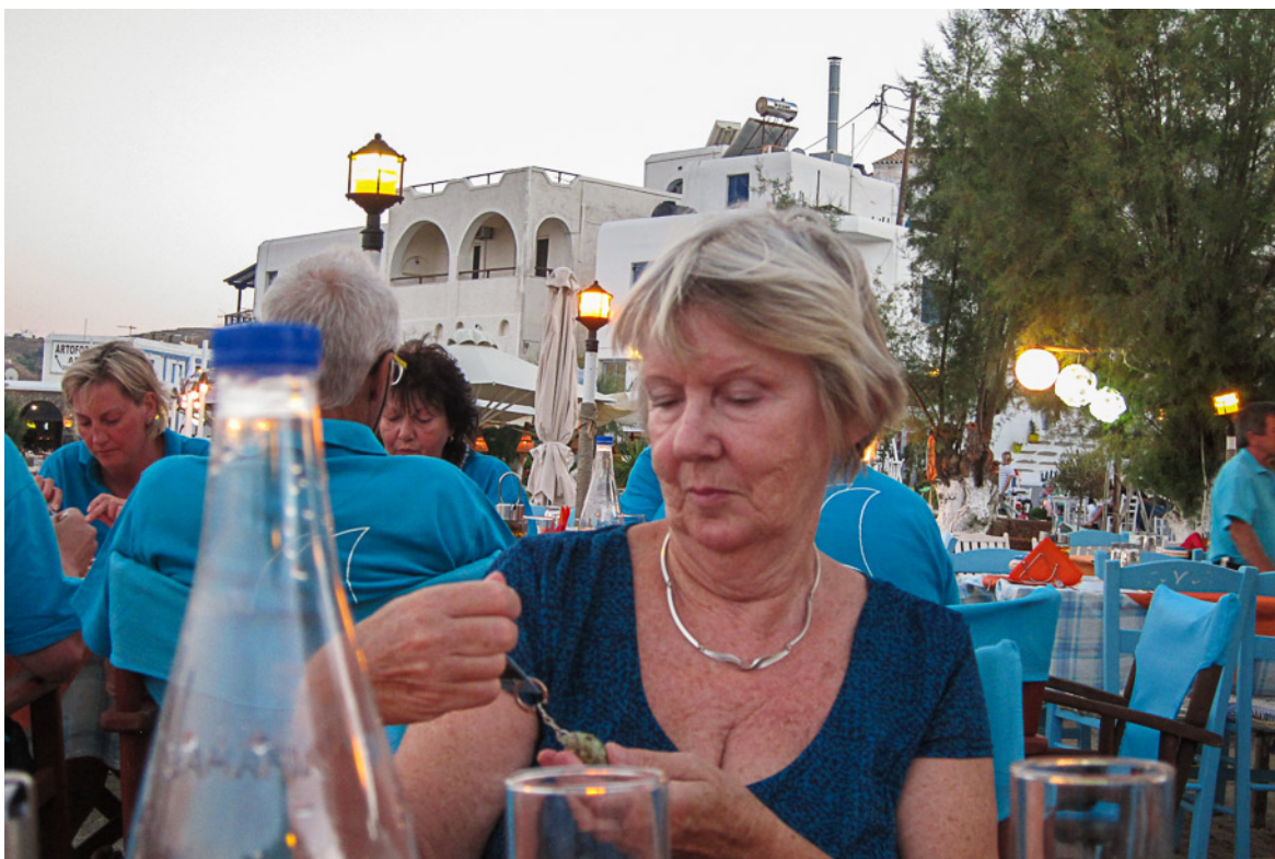
Loutra på Kithnos. Liten gåva från restaurangen