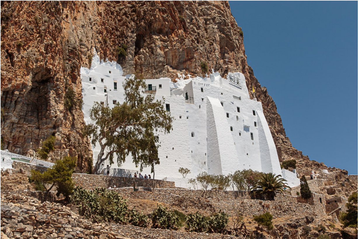
Klostret "Chozoviotissas" på ostsidan av Amorgos