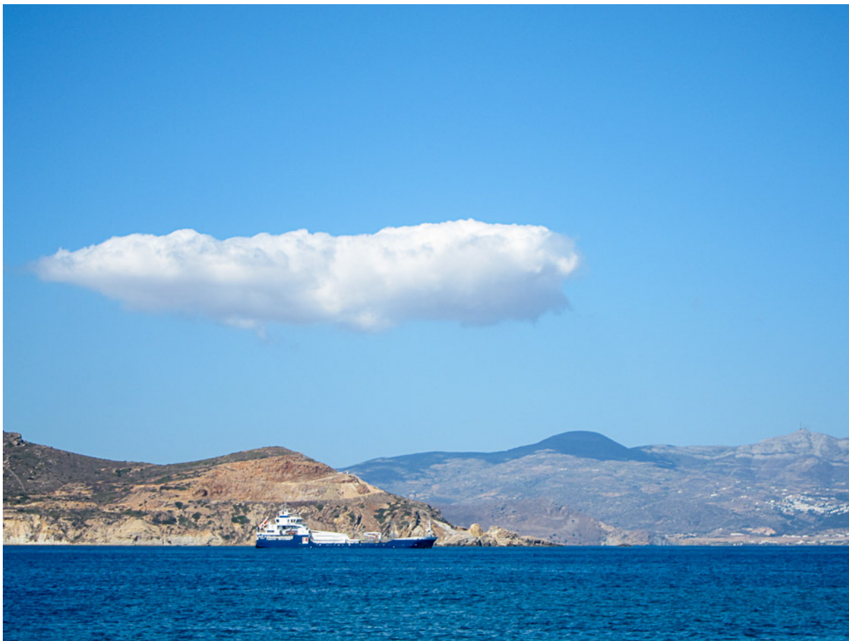
Cigarliknande moln över Paros på morgonen innan vi gick in i hamnen på Naxos