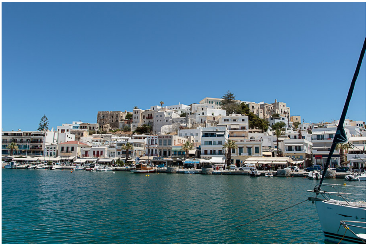
Naxos gamla stad