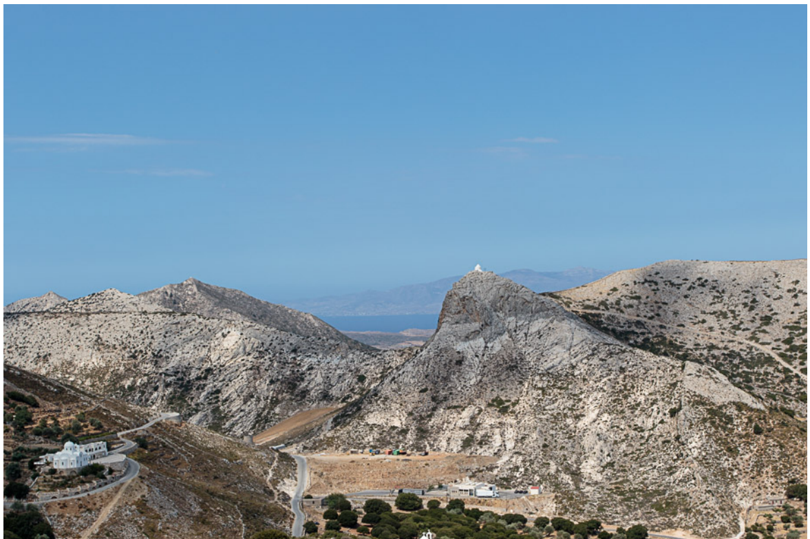
Vackra berg på Naxos. I fjärran skymtar Paros