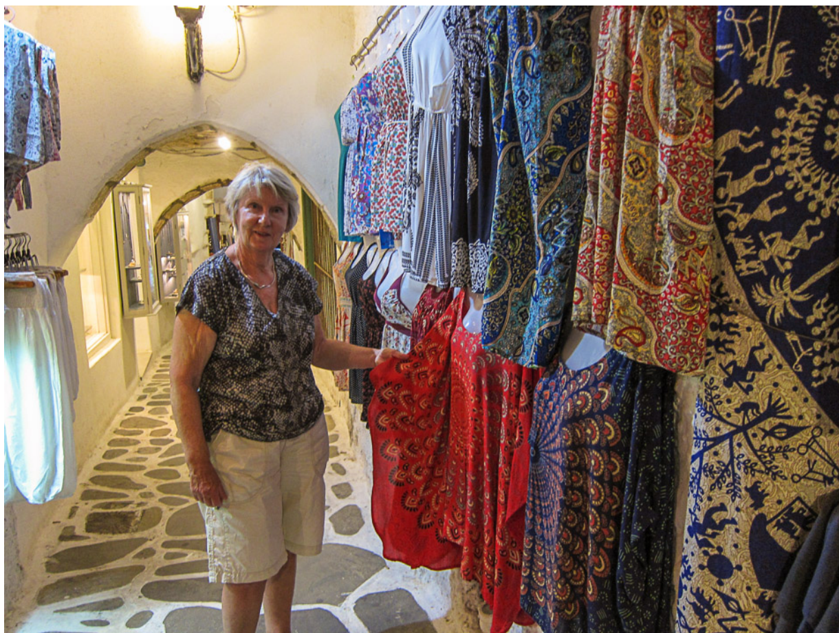
Shoppingtur i gamla stans gränder